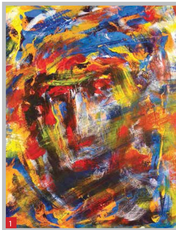
1. Bedouin , 2016 - Acrylique sur toile, 61X46 cm. 2. L'artiste dans son atelier . 3 Opium of Giverny , 2015 - Acrylique sur toile, 117 X 107 cm. 4. Désordre Installation : Saccaragia full metal , 2016 - Acrylique sur toile, 43 x 76 cm avec 18 toiles de 20 x 20 cm chacune.